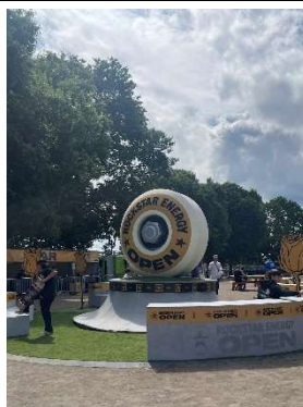
スケートボード会場