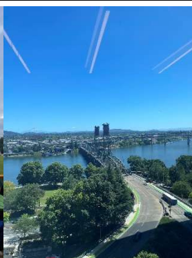
The Steel Bridge